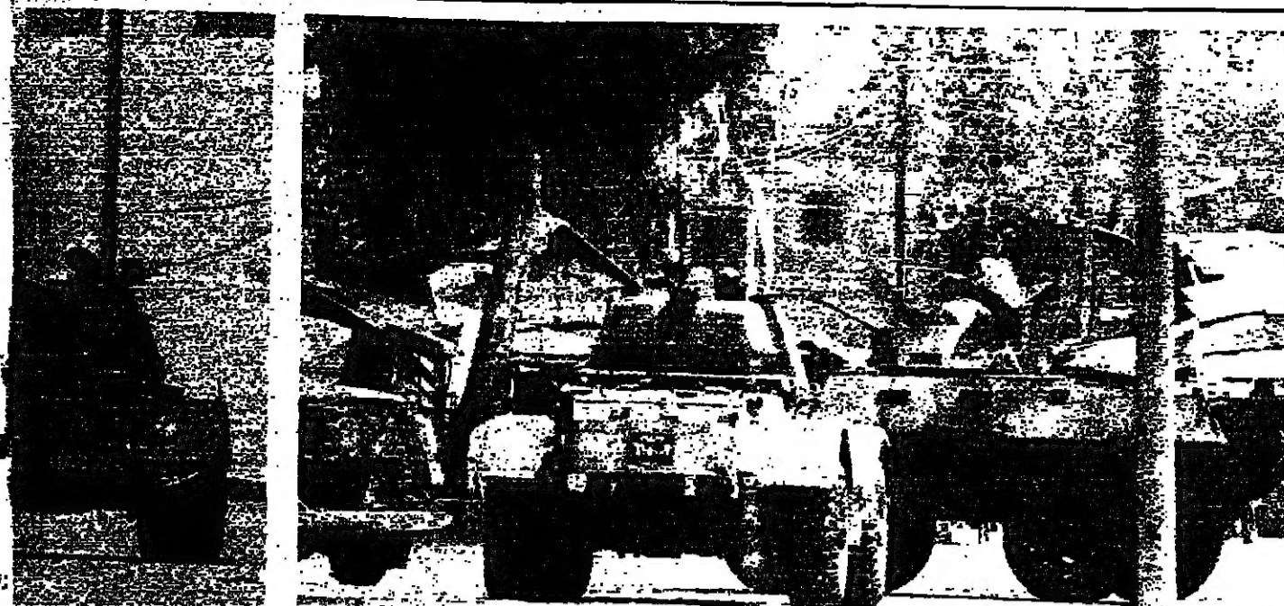
صفحات «الفرقة 16» بين اوكاخ الكرنيتينا - صحيفة تترك قرب